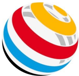
lanseo Scorekeeper NG

Zusätzlich zu den bereits bekannten Schießzetteln, wollen wir bei diesem Wettkampf eine elektronische Trefferaufnahme verwenden. Das bedeutet, dass pro Scheibe eine Person mit ihrem Smartphone die Ergebnisse elektronisch aufnimmt. Eine zweite Person wird, wie gewohnt, den Schießzettel ausfüllen. Die entsprechende App ist über die unten angegebenen Links bzw. QR-Codes zu finden.